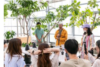
ファーマーズレクチャー