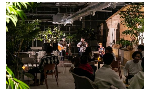
沖縄三線ショー・イメージ