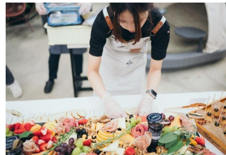
ケータリングのお食事でアレンジ・イメージ