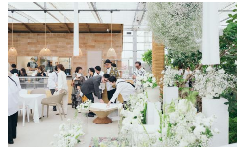
ウェディングパーティー・イメージ