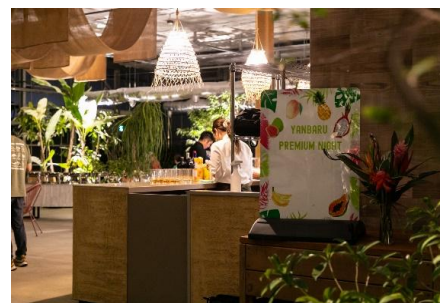
夜のプレミアムナイトパーティー・イメージ