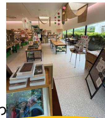
沖縄コーヒーを知る・楽しむ やんばるコーヒーベース新設！