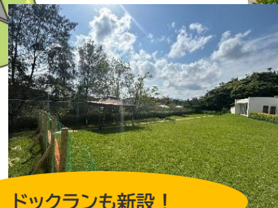
ドックランも新設！